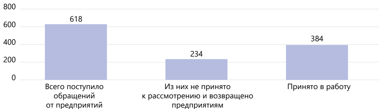
Рисунок 2. Количество обращений о заключении дополнительных соглашений к действующим лицензионным договорам и результаты их рассмотрения

направлять в адрес предприятий информационные письма с описанием ситуации.